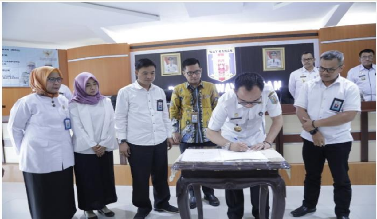
Pemerintah Kabupaten Way Kanan dengan Komisi Informasi Provinsi Lampung Tandatangani MoU Keterbukaan Informasi