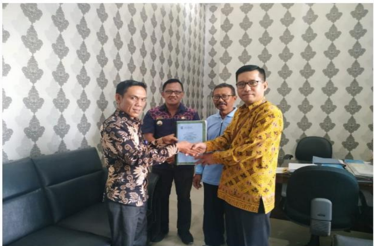
Diskominfo dengan Kepala Bagian Humas Serahkan Dokumen Data Dukung KI Tahun 2019