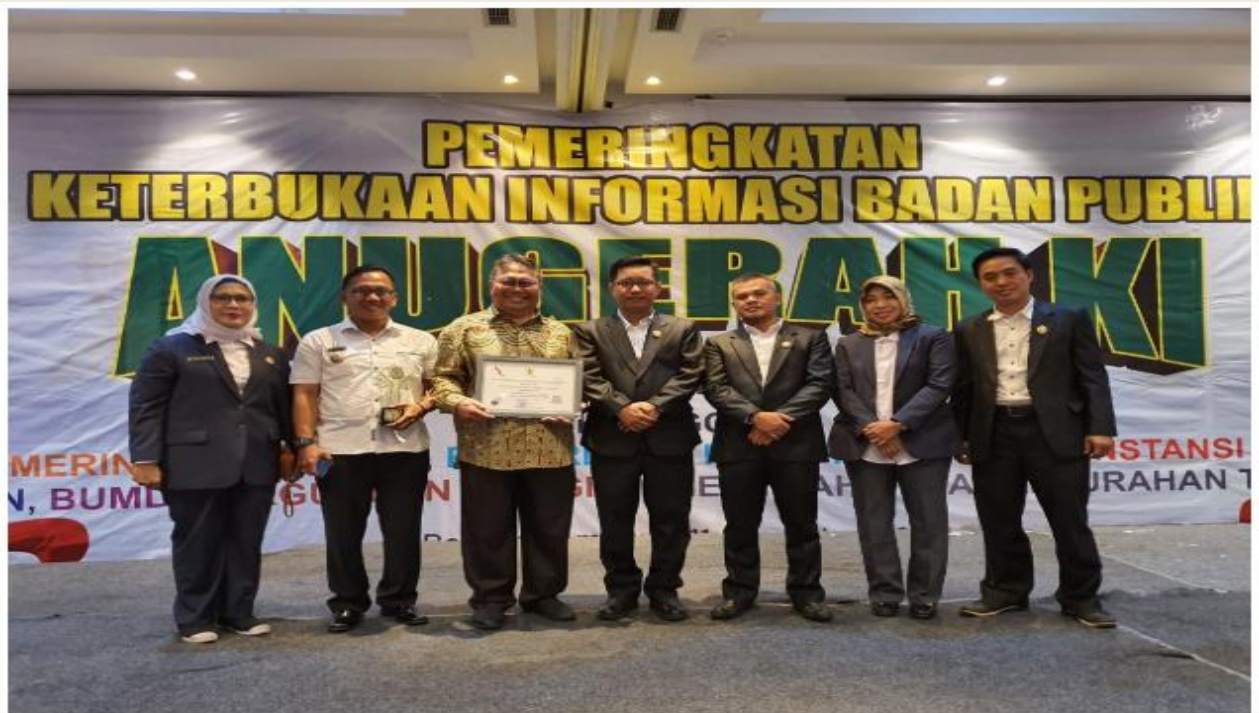
Penerimaan Peringkat Pertama Peningkatan Keterbukaan Informasi Publik Tahun 2019