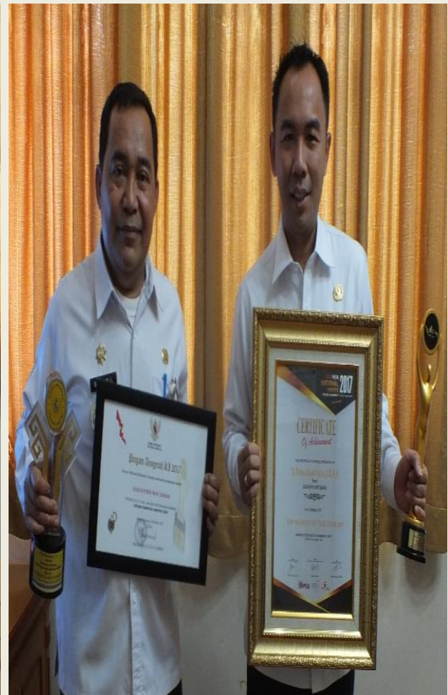
Menerima Peringkat Ke - V (Lima) Piagam Anugerah Keterbukaan Informasi Publik Kategori Kabupaten/Kota Tahun 2017 Dan Menerima Certificate Of Achievement Kategori penganugerahaan Top Regent of The Year 2017